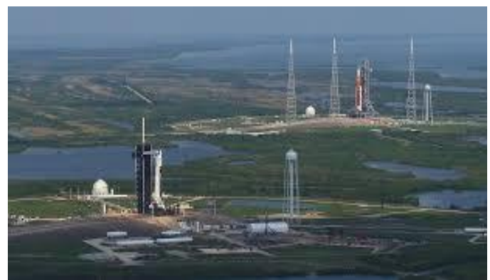
ケネディースペースセンター Launch Complex 39