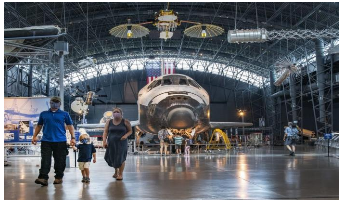
スミソニアン航空宇宙博物館別館 ディスカバリー号